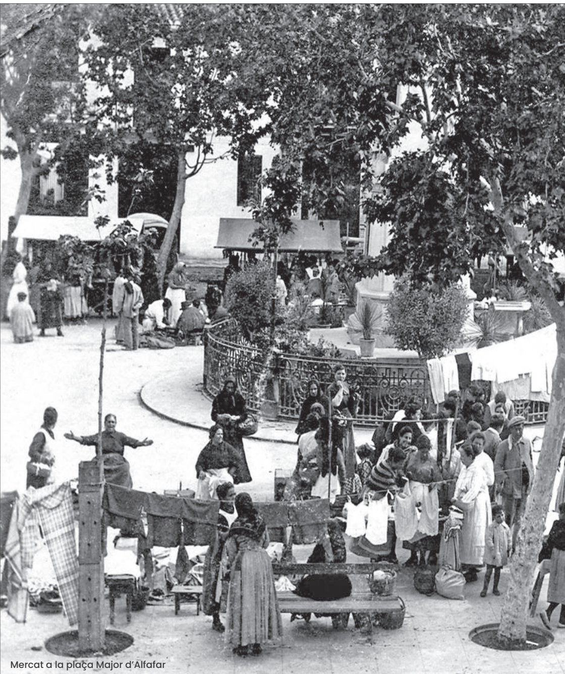
Mercat a la plaça Major d'Alfàfar