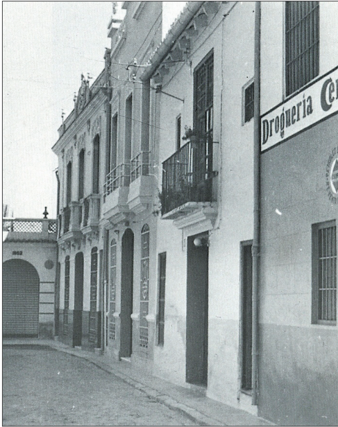
Antic carrer del Cementeri, amb el mercat al fons