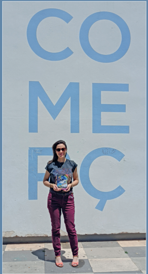
Guanyadora del sorteig del Dia de la Mare

Segueix Alfatar Comercial a Instagram, Facebook i TikTok per a no perdre't cap detall de l'actualitat del nostre teixit comercial i participa en els sortejos i concursos que organitza per a premiar la seua comunitat de seguidors i seguidores.