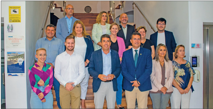
El president Carlos Mazón visita Alfatar per a conèixer la seua expansió comercial

Creix l'oferta de productes de la llar, alimentació i gastronomia a la zona comercial i s'impulsa 'Alfatar destino comercial'