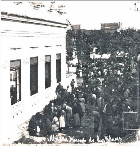
Mercat de les Aus a l'actual carrer del Sol

Parlar de l'origen i la història del Mercat d'Alfagar, ens porta ineludiblement a parlar de l'origen i la història del lloc on se situa i dels seus antecedents al poble. És difícil saber en quin moment va sorgir el primer mercat o com es va passar dels intercanvis primitius als intercanvis de mercat, però podem intuir que eixos primers intercanvis, de caràcter agrícola, es produïen a l'horta i el camp, i si avancem en el temps podríem localitzar-los a la plaça primigènica d'Alfagar, l'actual placeyta del Forn.