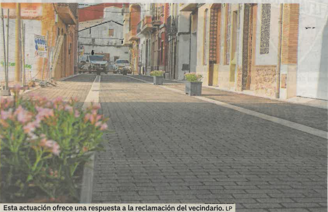
Esta actuación ofrece una respuesta a la reclamación del vecindario. LP