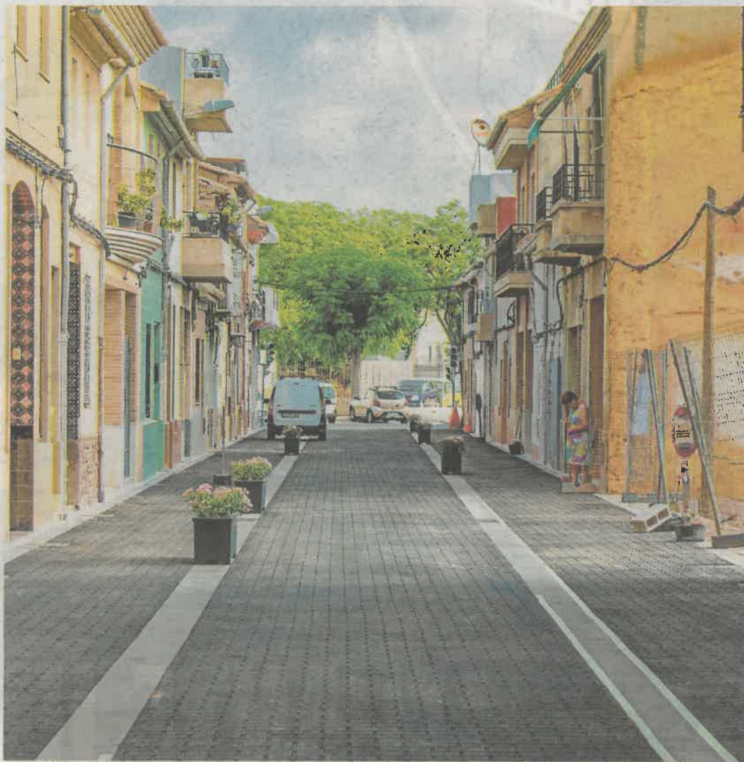
El proyecto reparte el espacio público a favor de caminar en la calle Bosch Marín de Alfatar. LP

El proyecto se ha realizado con un presupuesto de casi 134.000 euros