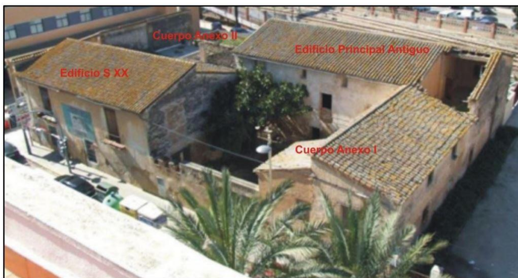
Fig 3. Vista aérea con las fases constructivas del edificio

Prácticamente todos los muros de la alquería están contruidos con ladrillo macizo o de Tapia Valenciana, es decir una tapia calicostrada que incorpora, para reforzarla, ladrillos adosados por el interior contra el encofrado o tapial.