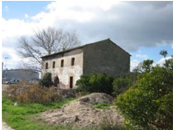
Vista Exterior: Fachada lateral.