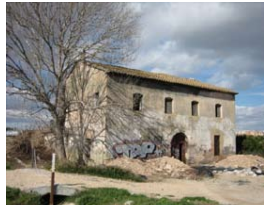
Vista Exterior: Fachada Principal.