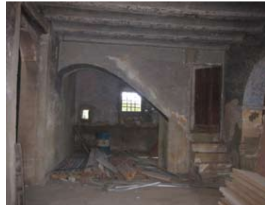
Vista Interior: Escalera en planta baja.