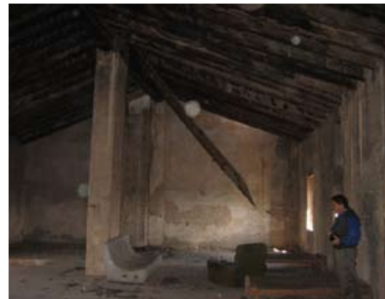
Vista Interior: Planta Alta.

La presente modificación de la Ordenanza entrará en vigor una vez publicado su texto completo en el Boletín Oficial de la Provincia, transcurrido el plazo previsto en el artículo 65.2 de la LrBRL 7/85, de 2 de abril, todo ello en los términos regulados en el artículo 70.2 del citado texto legal.