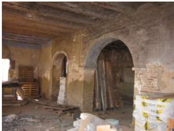
Vista Interior: Planta Baja.