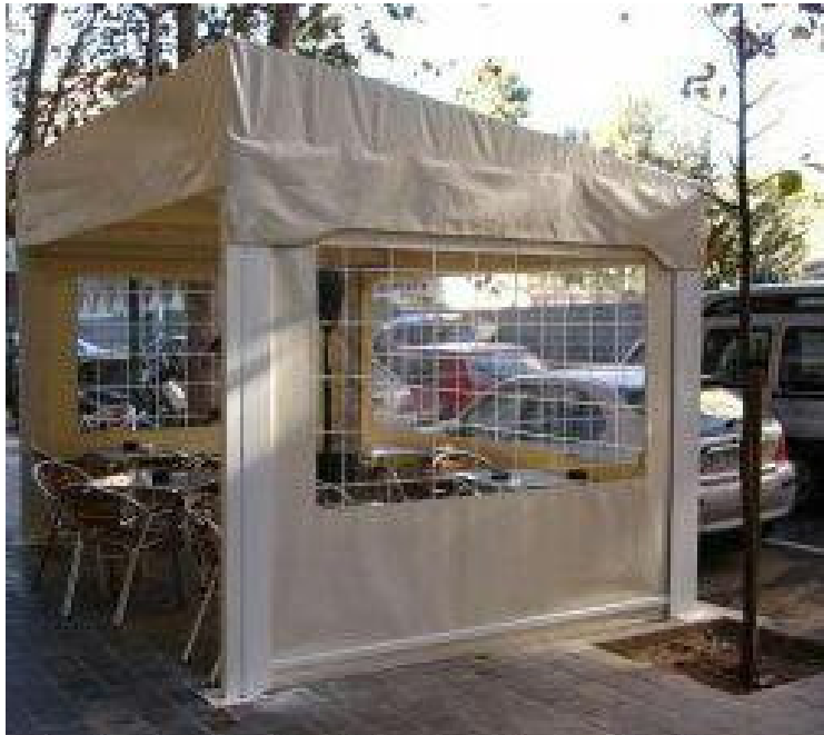
2.A. TOLDO CON TRES CERRAMIENTOS LATERALES EN ACERA.