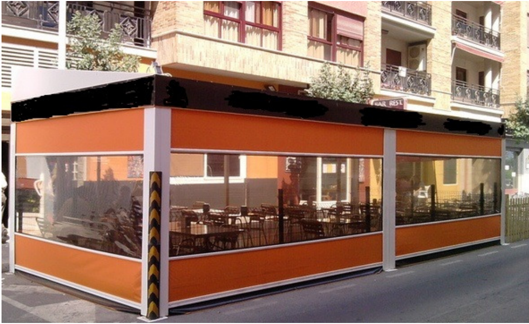
2.B. TOLDO CON TRES CERRAMIENTOS LATERALES EN CALZADA.

La presente Ordenanza, entrará en vigor una vez publicado su texto completo en el Boletín Oficial de la Provincia, transcurrido el plazo previsto en el artículo 65.2 de la LrBRL 7/85, de 2 de abril, todo ello en los términos regulados en el Art. 70.2 del citado texto legal.